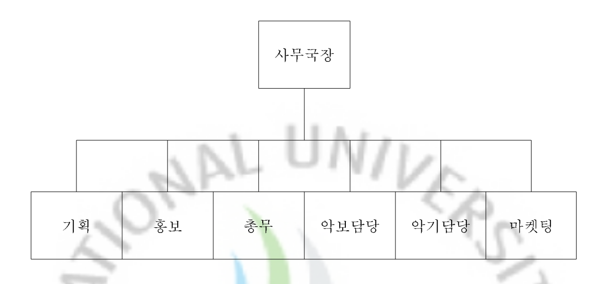
<표 17> 대전시향 사무국 직원 수 현황