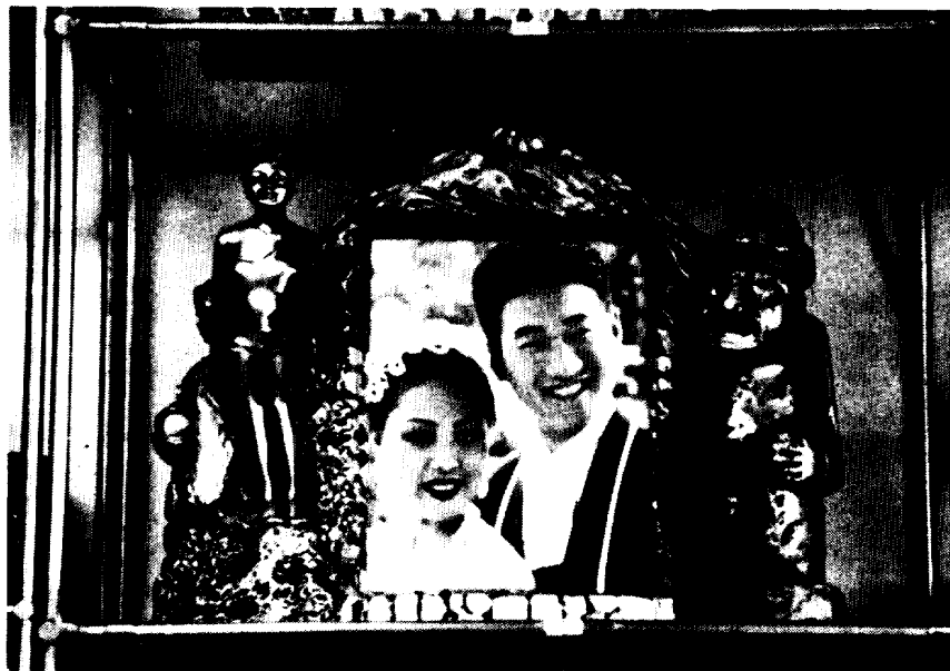
〈사진 9〉 신혼부부 사진틀 (토산품점)