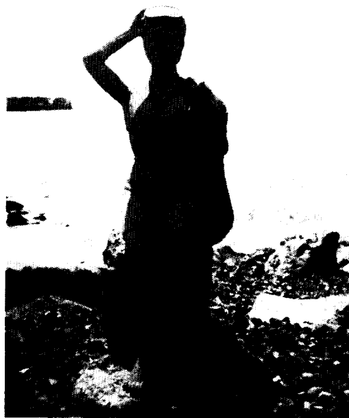
〈사진 3〉 애월읍 구엄리 해녀상 (해녀촌)

그러나 해녀촌의 해녀상들은 제주해녀를 흉내내고 있는 조형물일 뿐이다. 물옷을 입고 물질작업을 할 때는 머리수건이 필수적인데, 해녀상들은 모두 머리수건을 쓰지 않고 있다. 특히 구좌읍 동북리의 해녀상(사진 2)은 머리카락을 늘어뜨리고 있어 당시 제주해녀의 모습과는 거리가 멀다.