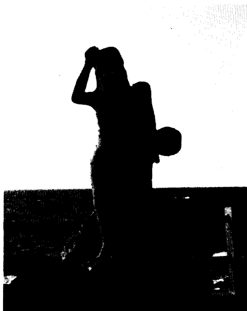
〈사진 2〉 구좌읍 동북리 해녀상(해녀촌)