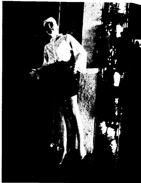
〈사진 6〉 해녀 마네킹 (토산품점)