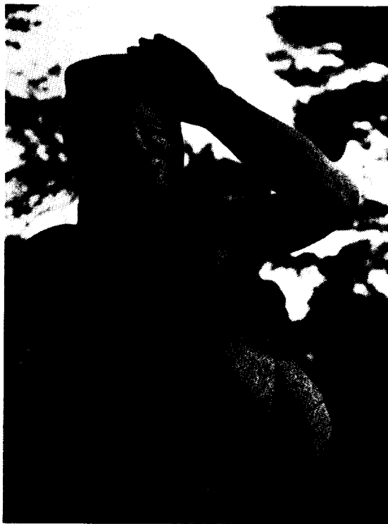
〈사진 5-1〉 해녀상 (부분)