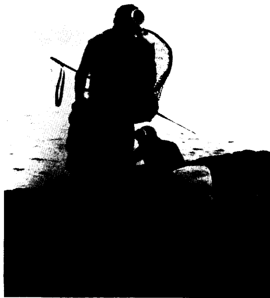
〈사진 11〉 작업 후 불턱으로 향하는 모습 (온평리)