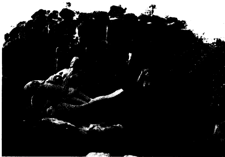
〈사진 4〉 인어와 魚神, 그리고 제주해녀 (석상제작소)