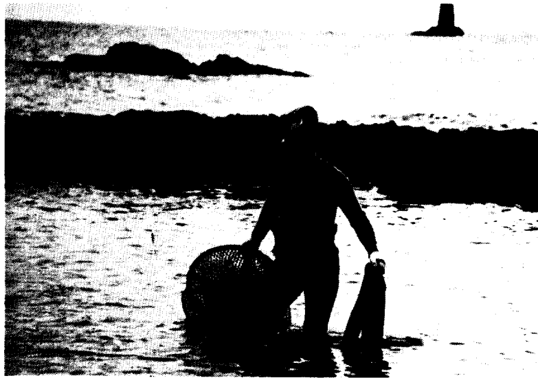
〈사진 10〉 작업을 마친 후 망시리를 들고 나오는 모습 (온평리)