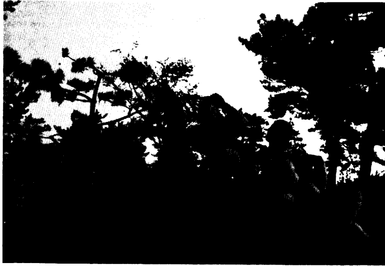
〈사진 5〉 해녀군상 (석상제작소)