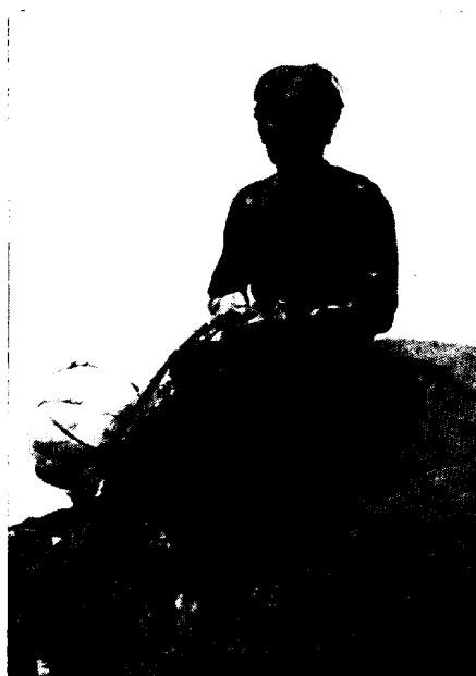
〈사진 13〉 최고령의 제주해녀 (우도)