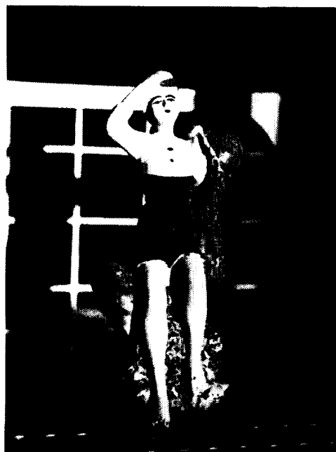
〈사진 7〉 장식용 해녀 좌상 (토산품점)