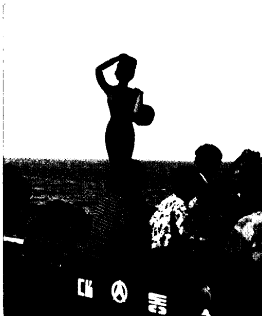
〈사진 12〉 귀가하는 제주해녀들(판포리)