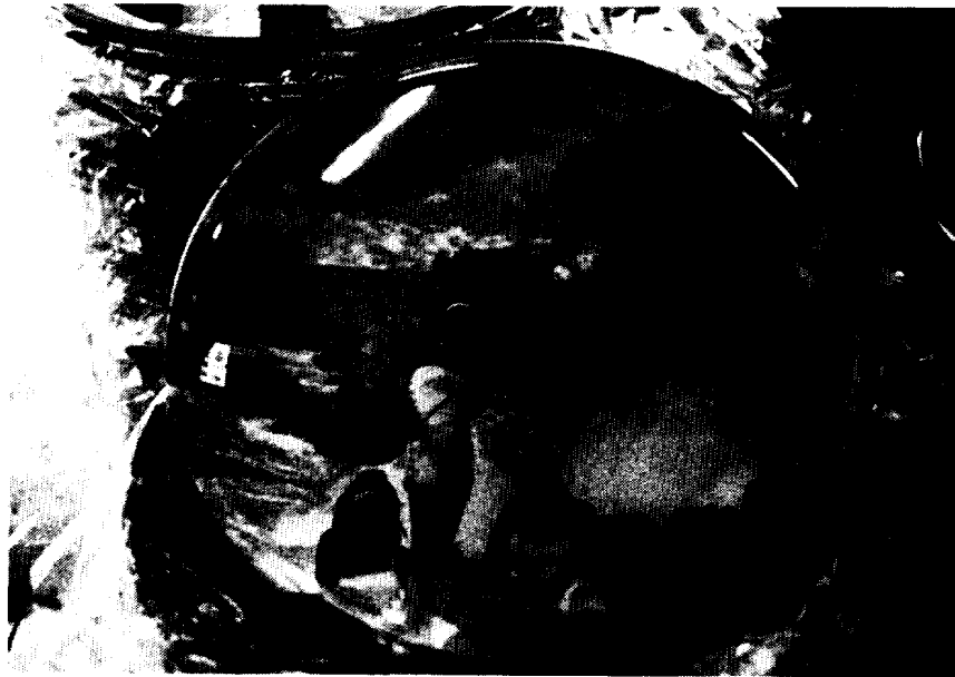
〈사진 8〉 해녀 쟁반 (토산품점)